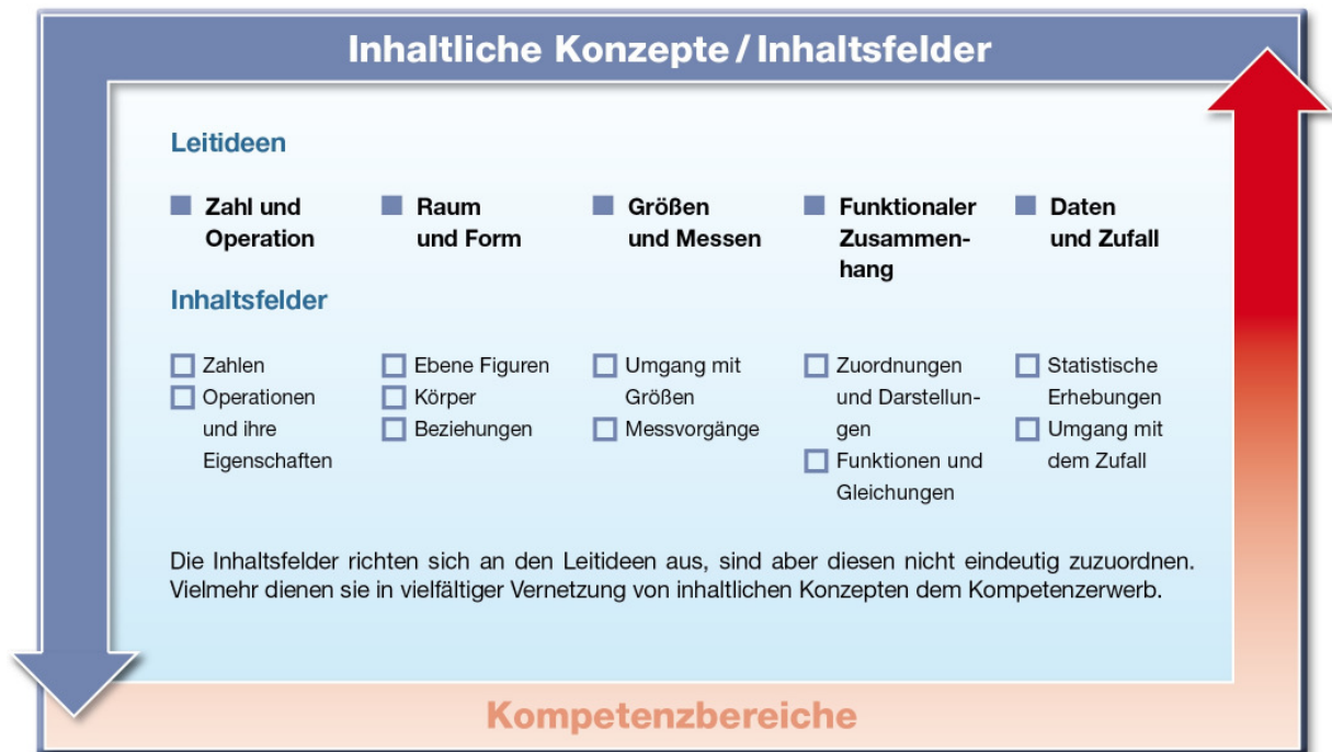
Abb. 2: Inhaltsfelder und Leitideen (inhaltliche Konzepte)

Kompetenzen sind erlernbare, kognitiv verankerte (weil wissensbasierte) Fertigkeiten und Fähigkeiten, die in konkreten Anforderungssituationen entwickelt werden 1 . Sie gehen daher über formale Kenntnisse oder abstraktes Wissen hinaus.